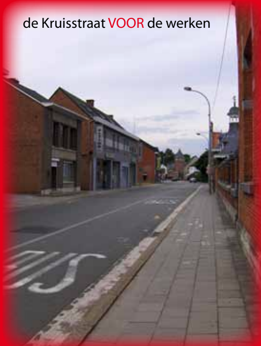
de Kruisstraat VOOR de werken